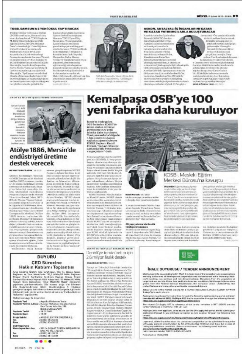
ŞEKİL 5-151 ULUSAL GAZETEDE PROJE REKLAMI

Müşterinin şu ana kadar gerçekleştirilmiş olduğu paydaş katılımı, Türk ÇED Kanununun 9. maddesi uyarınca yürütülen ÇED açıklama faaliyetinden oluşmaktadır. Müşteri, Projeye yönelik ilanı Şekil 5-1 ve Şekil 5-2'de görüldüğü üzere 11.02.2022 tarihli bir ulusal gazetede ve 11.02.2022 tarihli bir yerel gazetede yayımlamıştır.