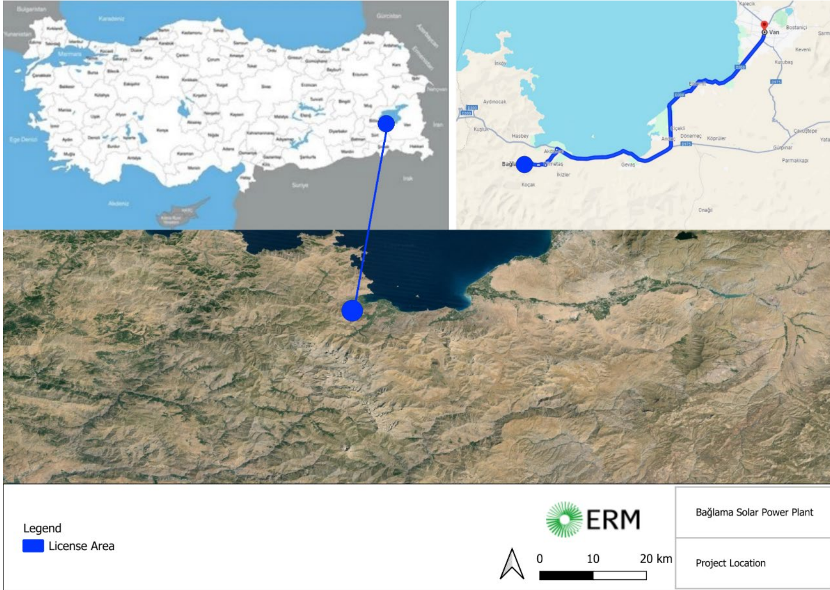
ŞEKİL 2-222 PROJE YER BULDURU HARİTASI